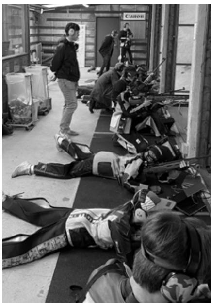
Til tider var det mange på 100m