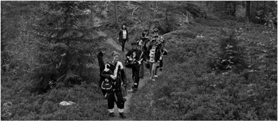
I Hafslo var det en litt landlig vei til skytebanen.