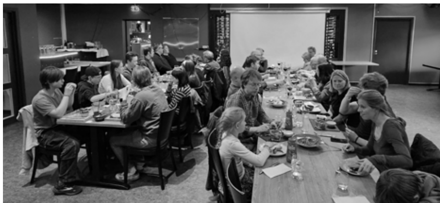
Fellesmiddag på lørdagskvelden.