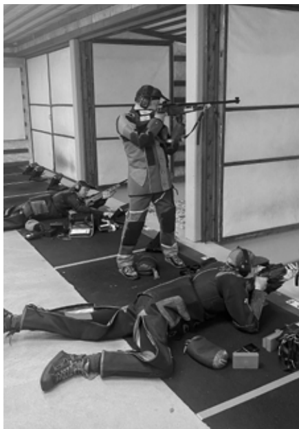
Trening på 200m.