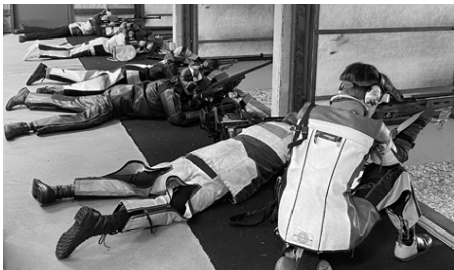
Fra innledende skyting.