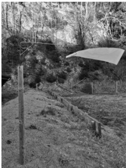
Nye vindvimpler ble satt ut.