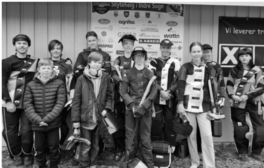
Ungdommene som var med til Lerumcup med trener.