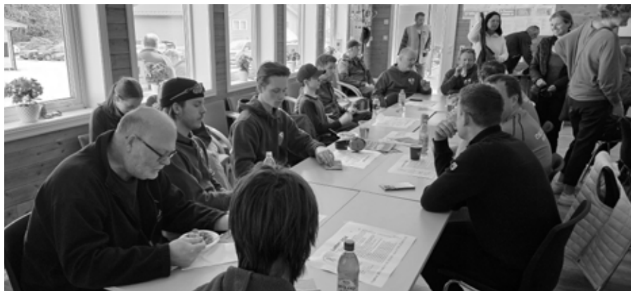
Samling i skytterhuset etter skyting i Leikanger.

Ellers var det god spredning i deltakelse over flere klasser fra alle ungdomsklasser, seniorer og veterander. Det ble skutt mye godt uten vi går inn i detaljer her.