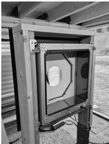
De nye terammene på 100m skivene.