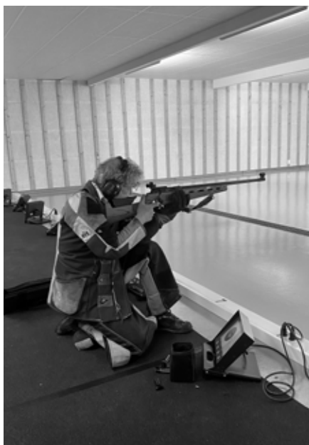
Noen benyttet også 15m banen.