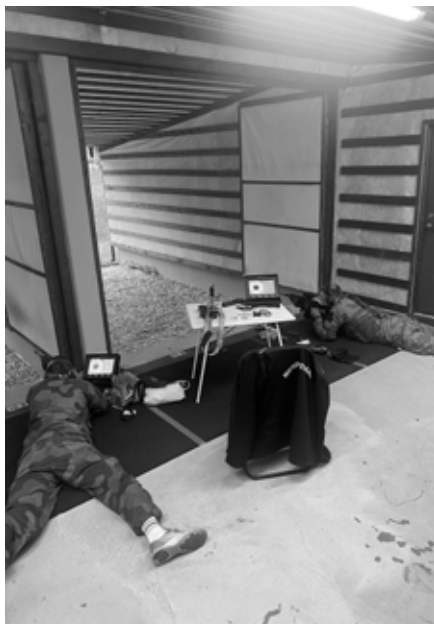
HV-skyttere var med.