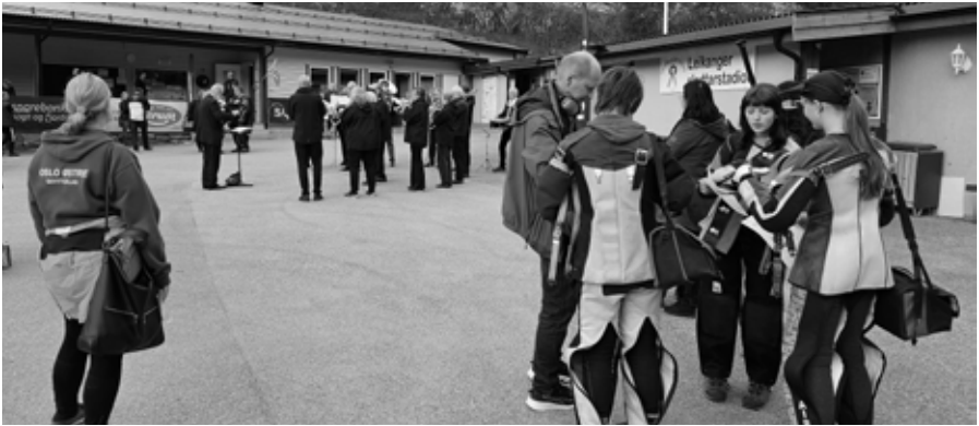
I Leikanger var det en opptreden fra et korps, men noen var mest opptatt av resultatene.