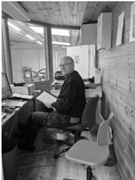
Det ble ryddet i standplassbua på 100m