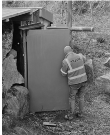
Døren til 200m grava ble malt.

Bildene nedenfor og på de neste sidene gir et inntrykk av noe av det som ble gjort.