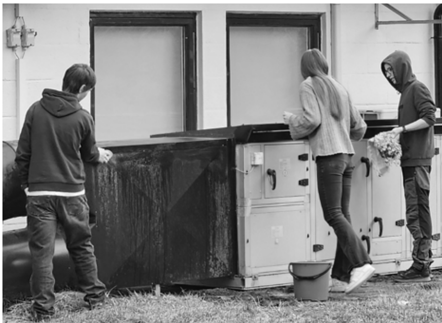
Ventilasjonsanlegget ble skrubbet for grønnske og rengjort.