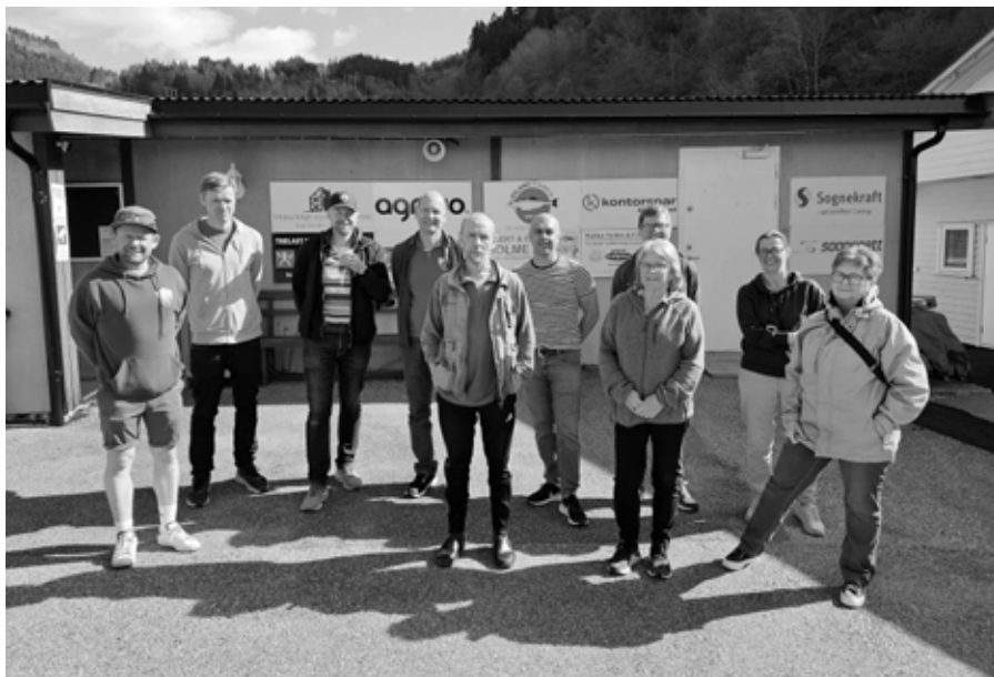
Støtteapparatet med foreldre og ledsagere er en viktig del av turen