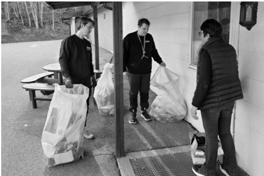
Søppel ble fraktet vekk.