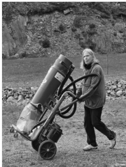
100m skivehus og 200m grav ble støvsugd