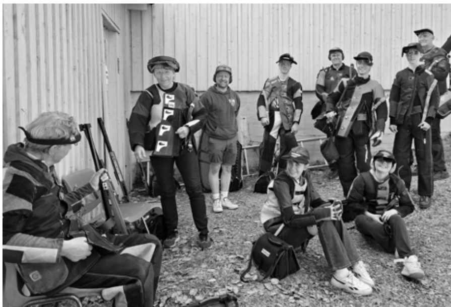
Unge og noe eldre skyttere like før skyting i Sogndal.