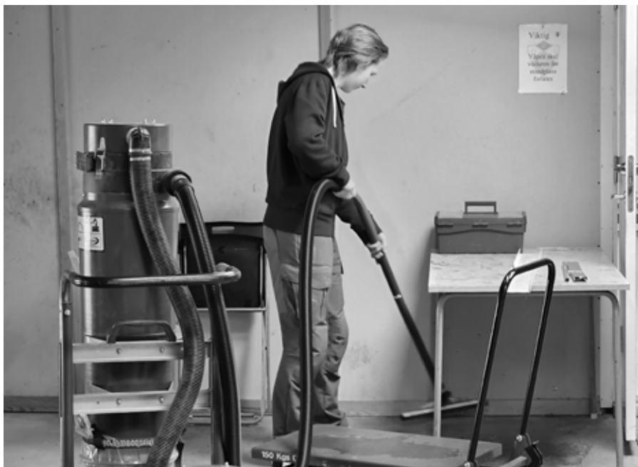
Hele anlegget ble støvsugd.