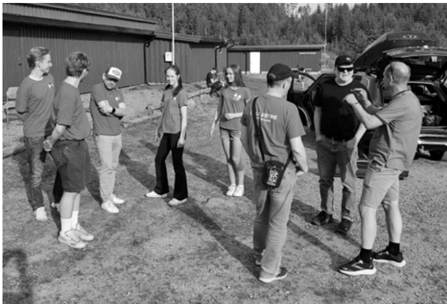
Det ble endel venitng i løpet av lørdagen.