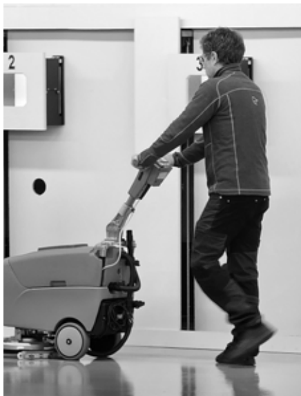
15m ble vasket