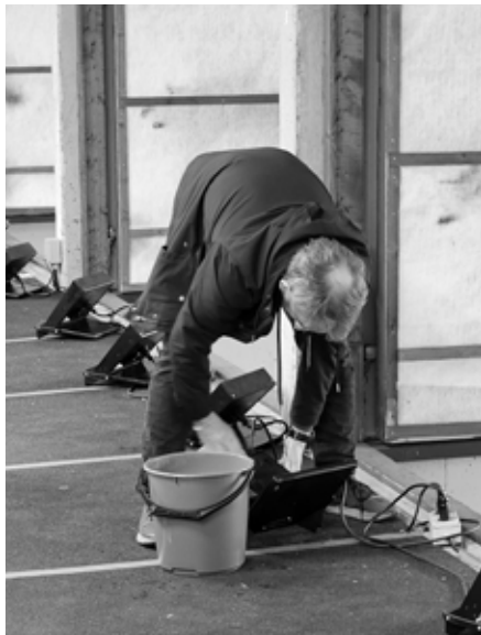
Monitorene ble vasket.